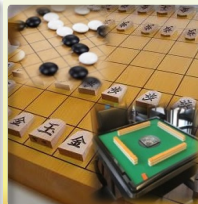
麻雀・囲碁・将棋