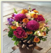
フラワー アレンジメント

コミュニティ倶楽部「これはじ」では利用者様の趣味や要望にもお応えしながら多彩な趣味活動の展開をいたします。