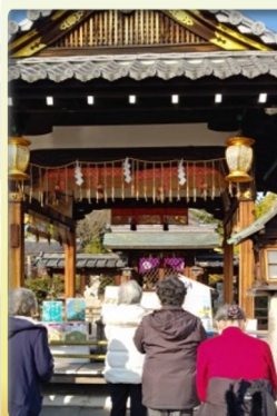
初詣など 神社へ参拝