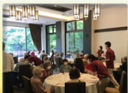
ホテル外食 バスツアー